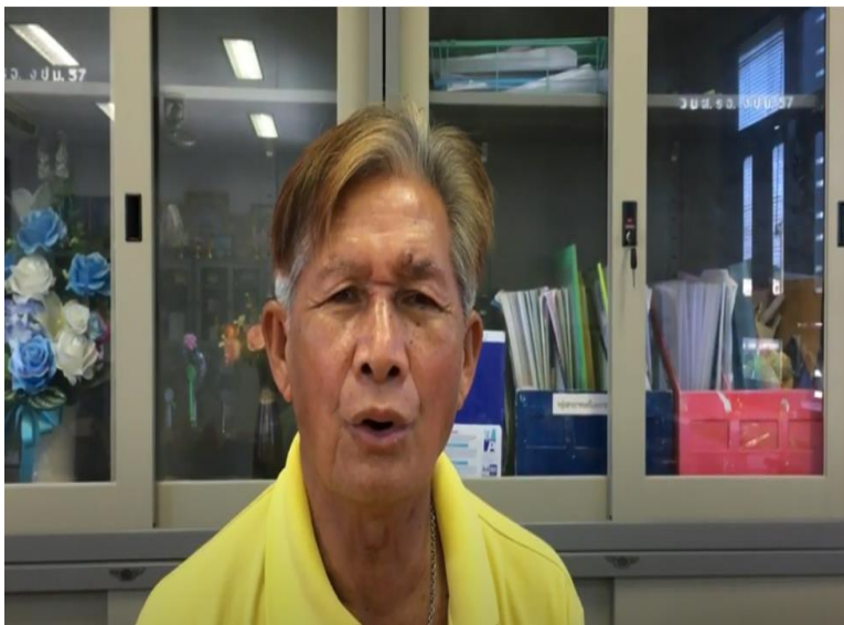
ภาพประกอบที่1