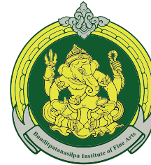
Chiangmai College of Dramatic Arts