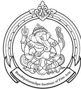
Faculty of Music And Drama