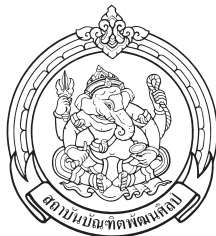
วิทยาลัยช่างศิลป์สุพรรณบุรี