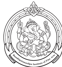
Suphan Buri College of Fine Arts