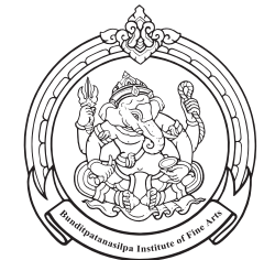
Chanthaburi College of Dramatic Arts