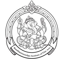
Sukhothai College of Dramatic Arts