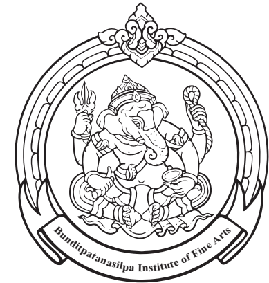
(ชื่อส่วนราชการภาษาอังกฤษ)