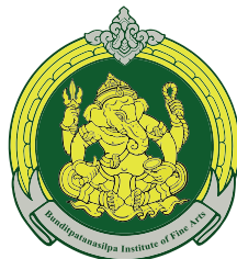
Kalasin College of Dramatic Arts