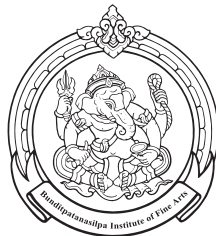
Kalasin College of Dramatic Arts