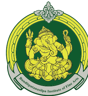
Faculty of Fine Arts