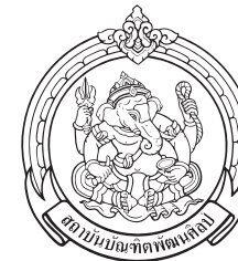
วิทยาลัยนาฏศิลป์จันทบุรี