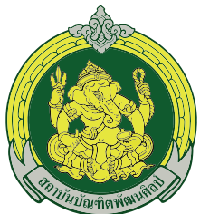
วิทยาลัยนาฏศิลป์กาฬสินธุ์