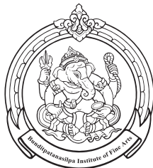
College of Fine Arts