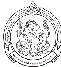
Suphan Buri College of Dramatic Arts