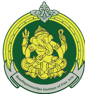
Faculty of Music And Drama