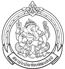
วิทยาลัยนาฏศิลป์พัทลุง