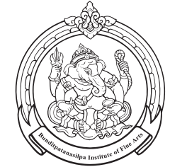
Nakhon Si Thammarat College of Dramatic Arts