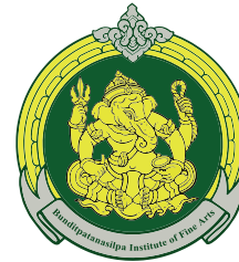
Roi Et College of Dramatic Arts