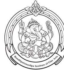
Chiangmai College of Dramatic Arts