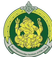
Suphan Buri College of Fine Arts