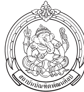
คณะศิลปวิจิตร