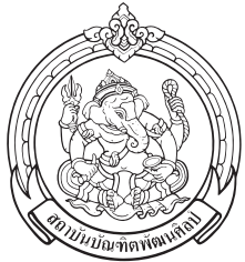
วิทยาลัยนาฏศิลป์อ่างทอง