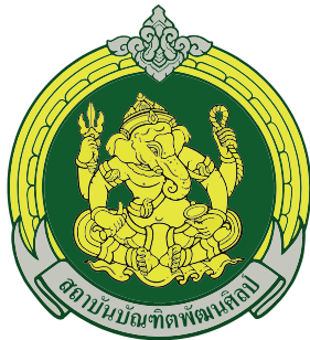
คณะศิลปนาฏดุริยางค์