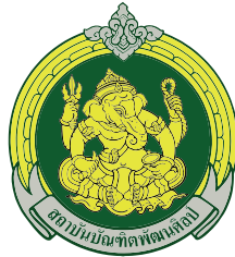
วิทยาลัยนาฏศิลป์เชียงใหม่