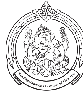
Faculty of Fine Arts