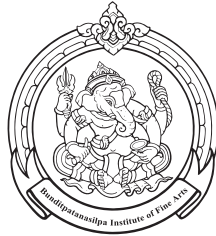
The College of Dramatic Arts