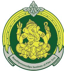
Ang Thong College of Dramatic Arts