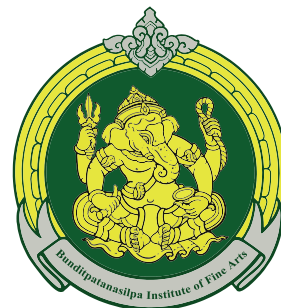
Faculty of Art Education