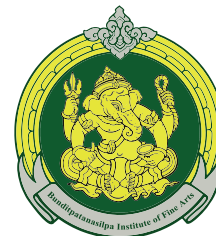
Lop Buri College of Dramatic Arts