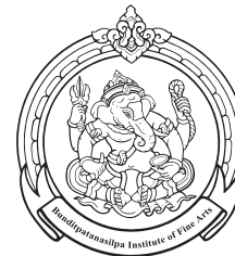
Lop Buri College of Dramatic Arts