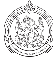
Roi Et College of Dramatic Arts