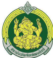
วิทยาลัยนาฏศิลป์ลพบุรี