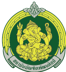
วิทยาลัยช่างศิลป์สุพรรณบุรี